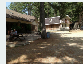
Foto degli edifici

Il Centro di spiritualità "Villaggio Ardorino" dispone di circa 50 posti letto in camere doppie o triple (anche con letti a castello, ma sufficientemente comodi). Buona parte delle stanze sono dotate di bagno proprio. Le poche stanze singole sono riservate ai relatori e a qualche caso di particolare necessità. Portare con sé lenzuola ed asciugamani, oltre agli altri effetti personali, tra cui indumenti adatti per la montagna (la sera e al mattino fa freddo).